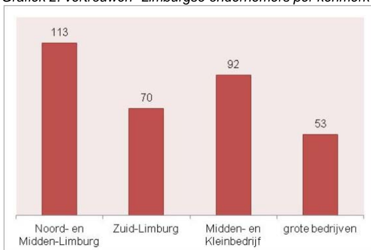
Grafiek 2: vertrouwen 1 Limburgse ondernemers per kenmerk 1e kwartaal 2011:

Als we kijken naar de kenmerken van de bedrijven, blijkt vooral het Midden- en Kleinbedrijf positief naar de toekomst te kijken. Verder zijn de ondernemers in Noord-Limburg positiever dan de ondernemers in Zuid-Limburg.